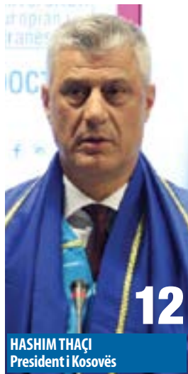
HASHIM THAÇI President i Kosovës