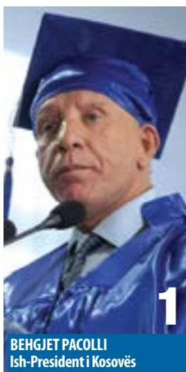
BEHGJET PACOLLI Ish-President i Kosovës

Në traditën e universiteteve më të njohura ndërkombëtare, UET akordon me një frekuencë 1-2 tituj Honoris Causa në vit. Duke shenjuar si një mirënjohje e institucionit për veprimtarinë e jetës apo akte me interes të posaçëm në lidhje me Shqipërinë, zhvillimin, shkencën, kulturën etj. UET përzgjedh personalitete shqiptare apo të huaja, figura politike, shkencëtarë, juristë, filozofë, shkrimtarë apo nobelistë dhe figura institucionale. Në vitin e 15 akademik 2020-2021 UET do të akordojë titullin e 15-të