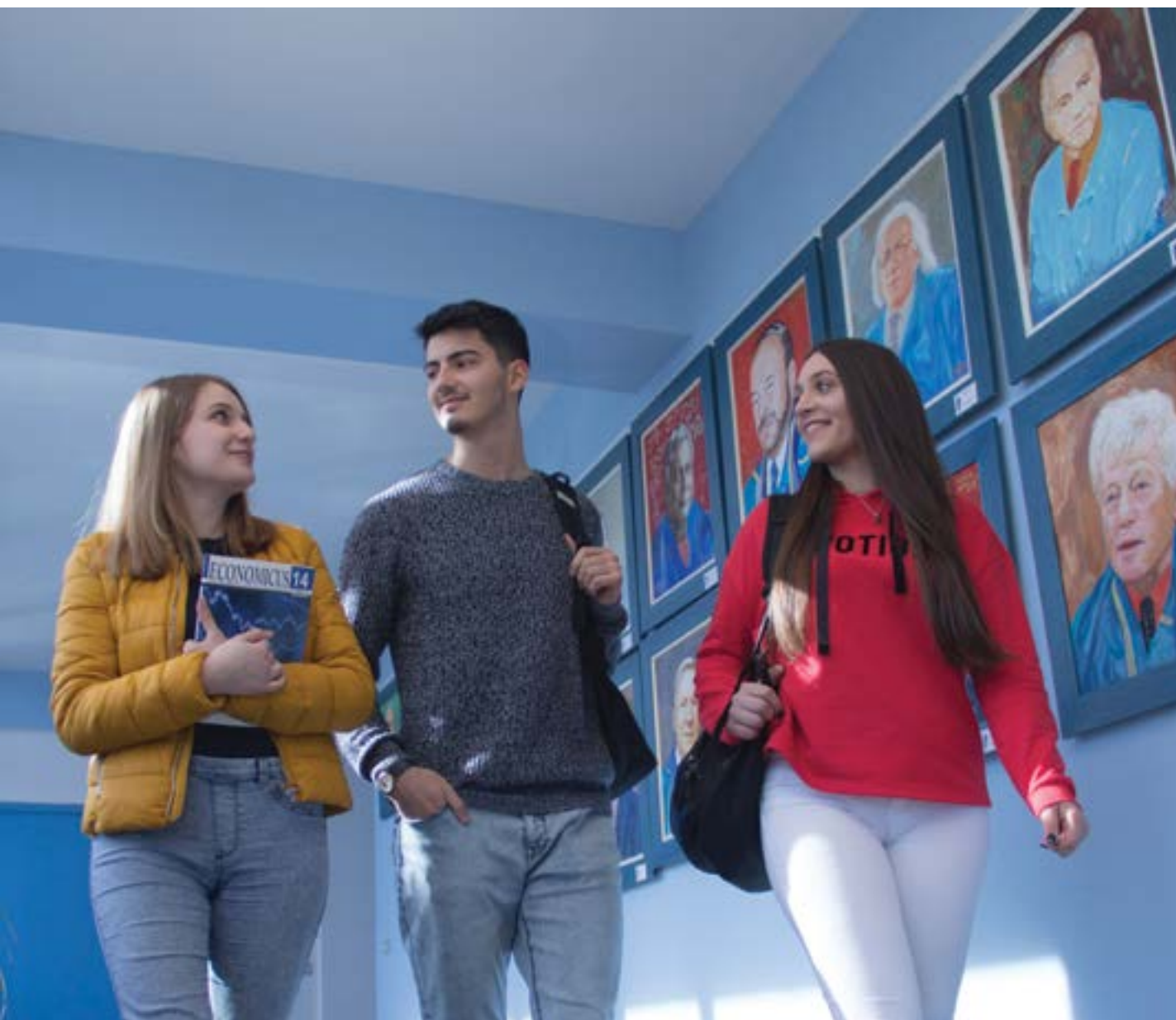
Studentë në Hall of Fame UET, mars 2018