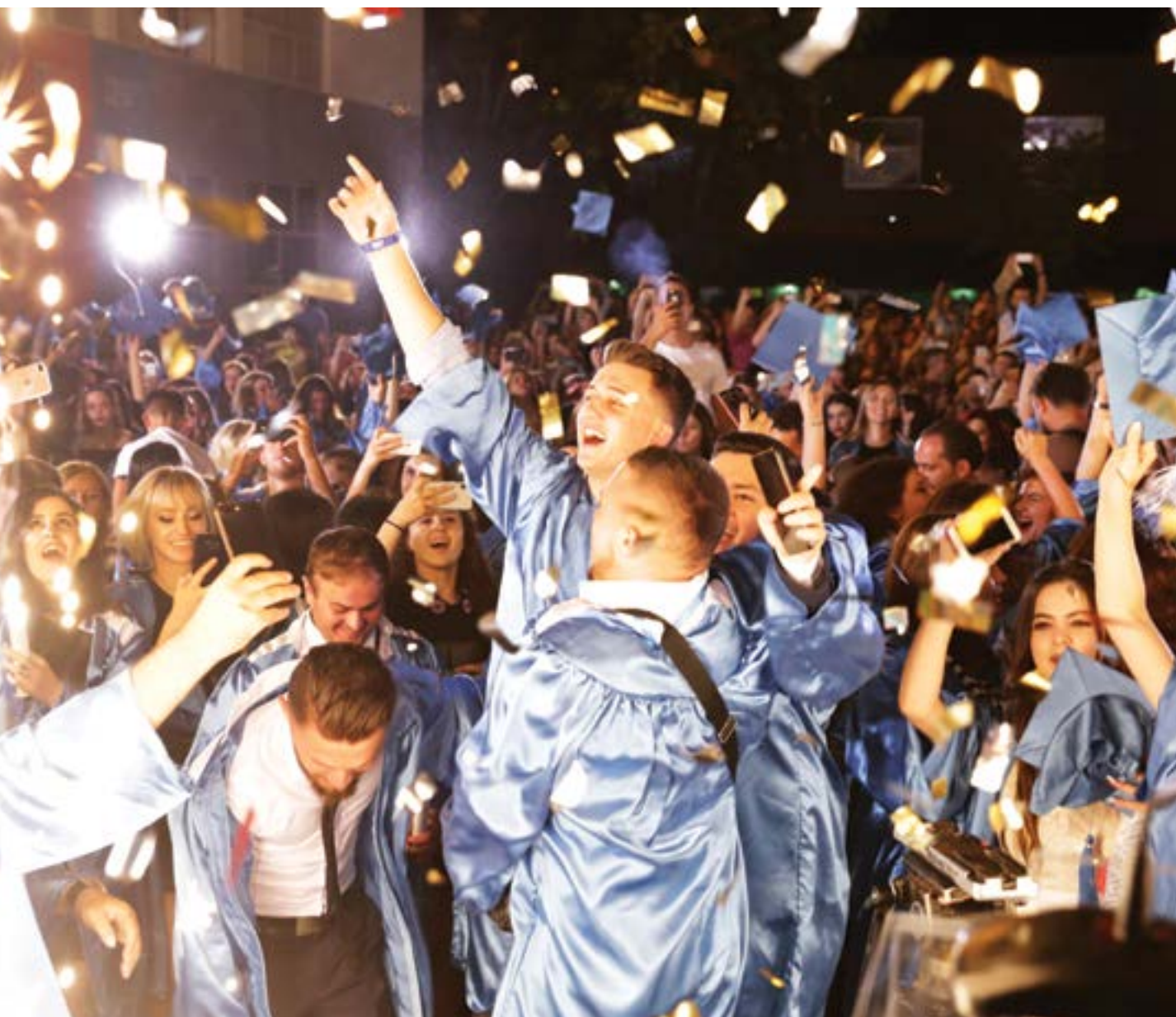
Ceremonia e Diplomimit, korrik 2018