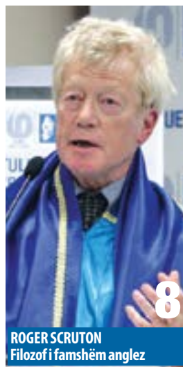
ROGER SCRUTON Filozof i famshëm anglez