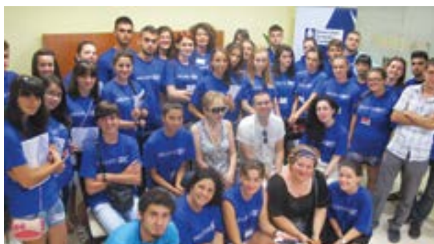
Shkolla e parë sezonale, 2012