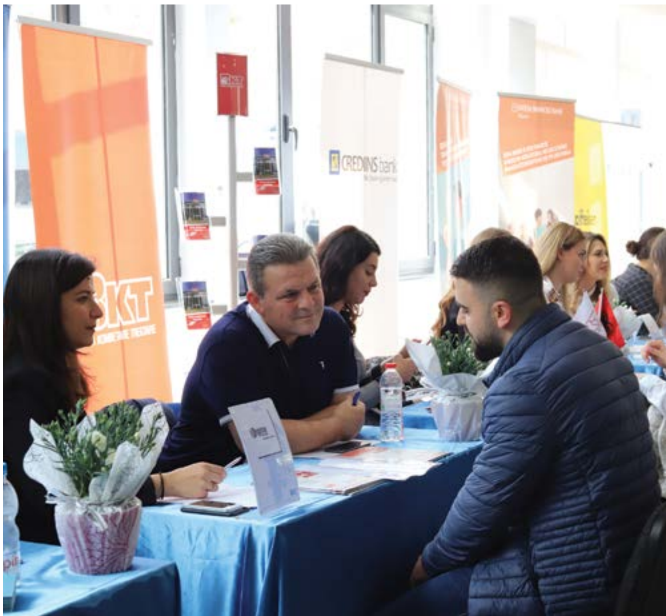
Dita e Biznesit në UET. UET Open Weeks 2019, Panairi i Punës