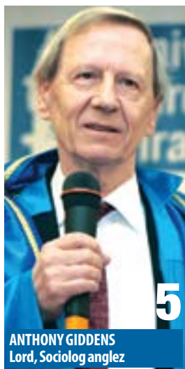
ANTHONY GIDDENS Lord, Sociolog anglez