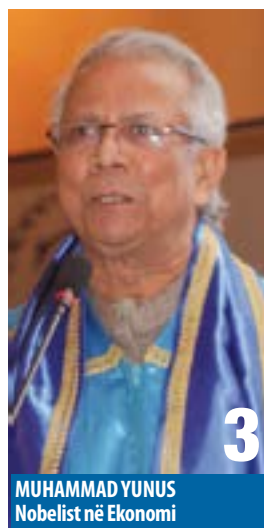
MUHAMMAD YUNUS Nobelist në Ekonomi