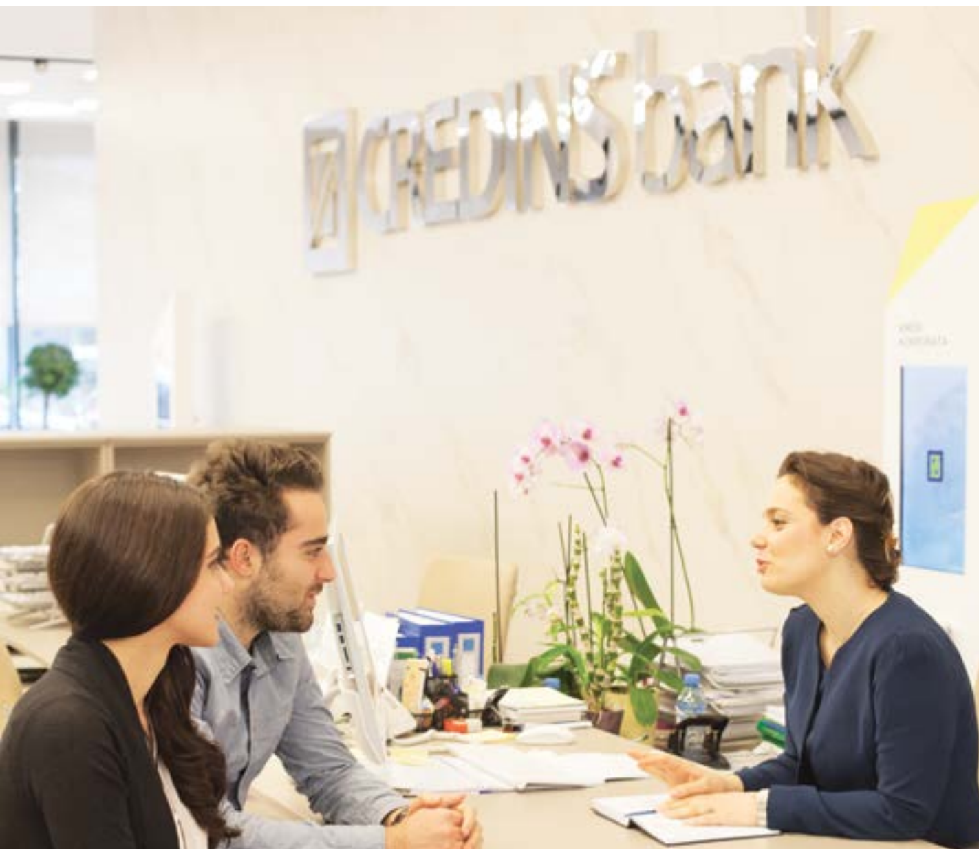
Studentë gjatë aplikimit në bankë të nivelit të dytë për financim të studime me interes 0