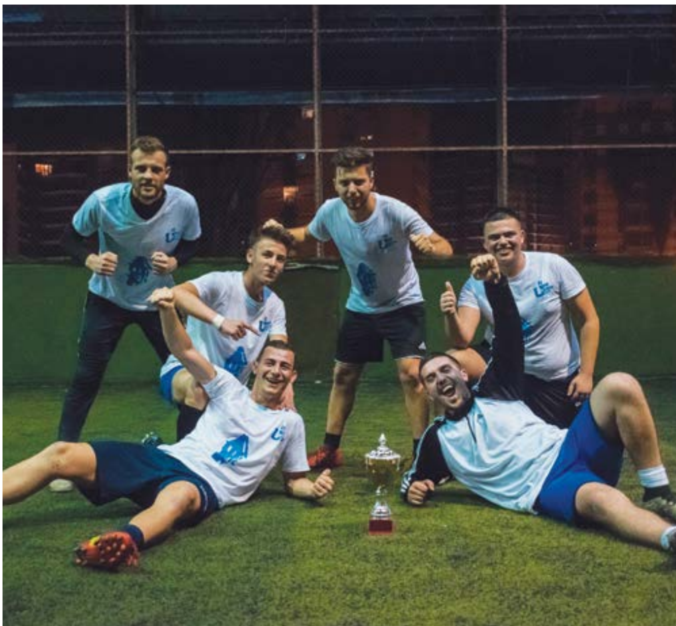
Sport Club UET 2019. Finalja e Kampionatit të Futbollit UET