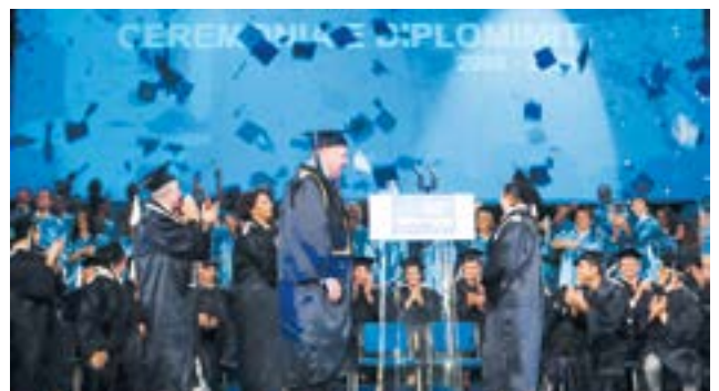
Ceremonia e diplomimit të parë, 2009