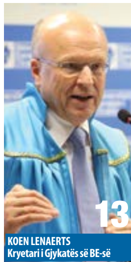
KOEN LENAERTS Kryetari i Gjykatës së BE-së