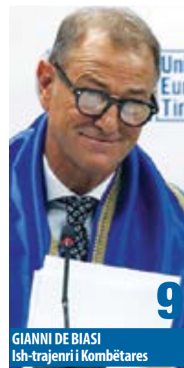
GIANNI DE BIASI Ish-trajneri i Kombëtares