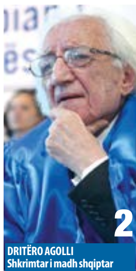
DITËRO AGOLLI Shkrimtar i madh shqiptar