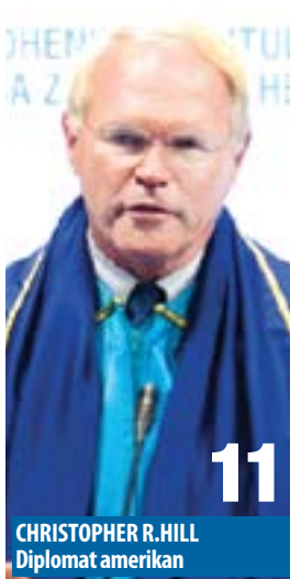
CHRISTOPHER R. HILL Diplomat amerikan