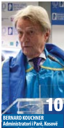
BERNARD KOUCHNER Administratori i Parë, Kosovë