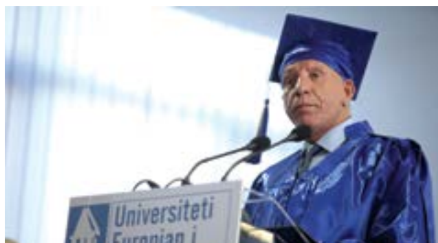
Behgjet Pacolli, Honoris Causa i parë, 2011