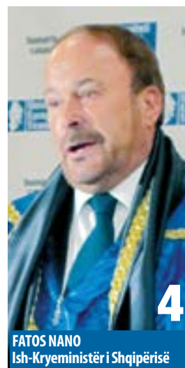
FATOS NANO Ish-Kryeministër i Shqipërisë