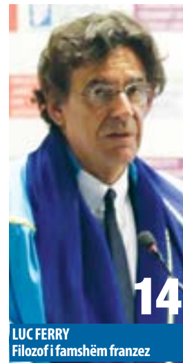
LUC FERRY Filozof i famshëm francez