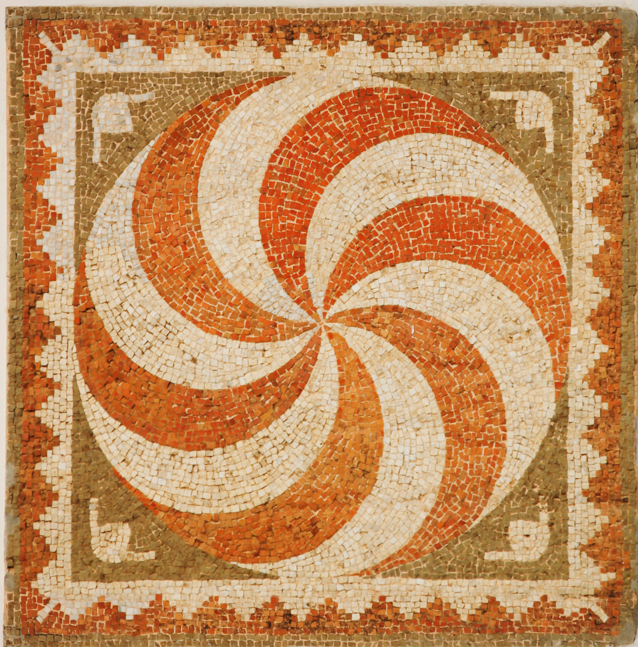
Mozaiku i Tiranës, shek. I A.D.

Adresa: Bulevardi Gjergj Fishta, Nd. 70, H.1, Tiranë, Cel. 068 20 16 616, info@uet.edu.al , www.uet.edu.al